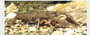
Gambero di fiume