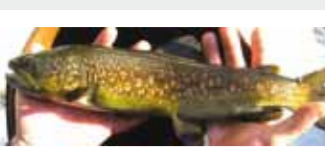
Ibrido di trota Fario-Marmorata