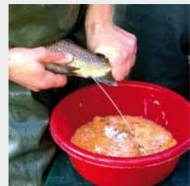
Spremitura per fecondazione