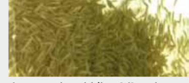
Avannotti nati (dim. 2/3 cm)