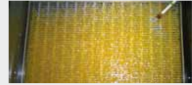
Uova in incubatoio